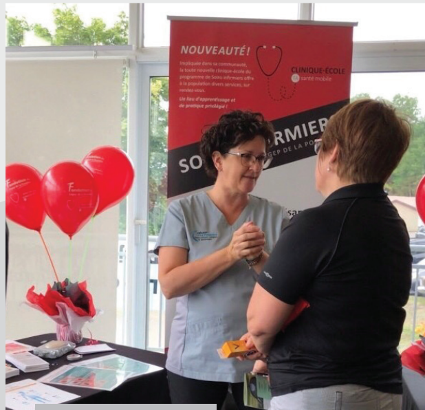
Soins infirmiers golf 2019