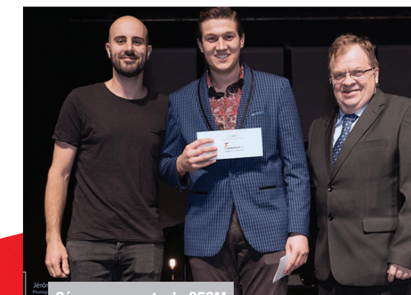
Cégep en spectacle CECM