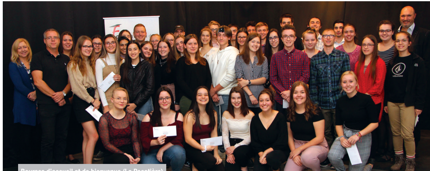
Bourses d'accueil et de bienvenue (La Pocatière)