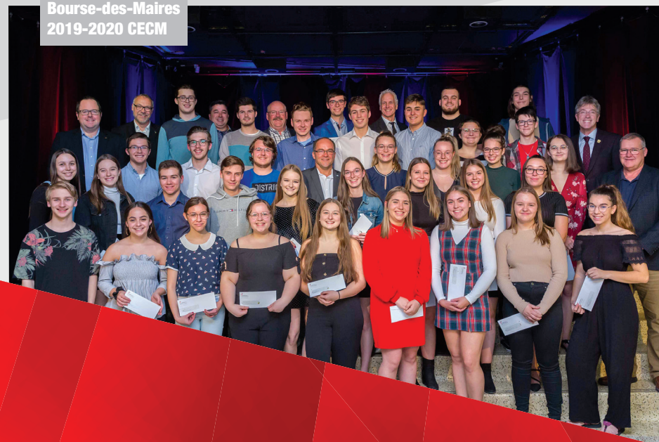
Bourse-des-Maires 2019-2020 CECM

Les membres du conseil d'administration et le personnel de la Fondation remercient tous les donateurs de la communauté collégiale, toutes les entreprises et organisations donatrices, ainsi que tous les bénévoles pour leur engagement et leur travail. Vous êtes importants pour nous, pour nos étudiants.