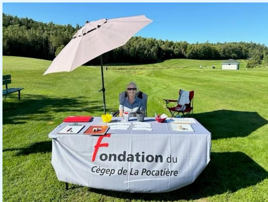
Club de golf de Saint-Pacôme

Elle a aussi participé du tournoi de golf de la Chambre de commerce de Kamouraska-L'Islet en y tenant un kiosque d'information le jeudi 29 août .