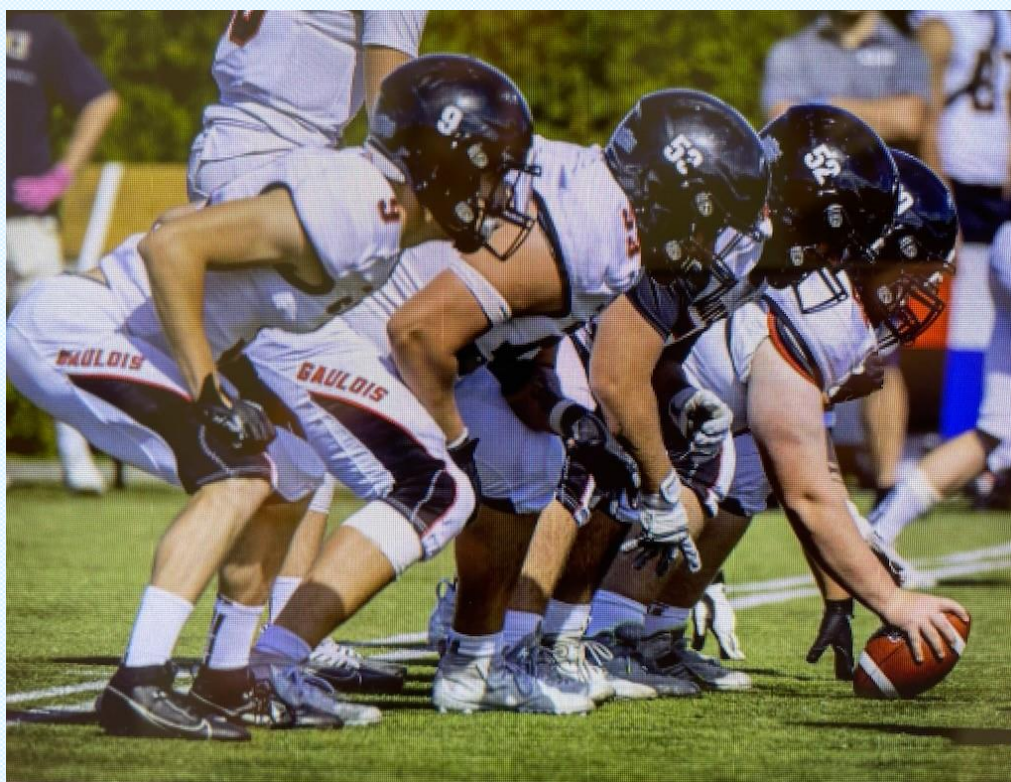
Les Gaulois en position offensive