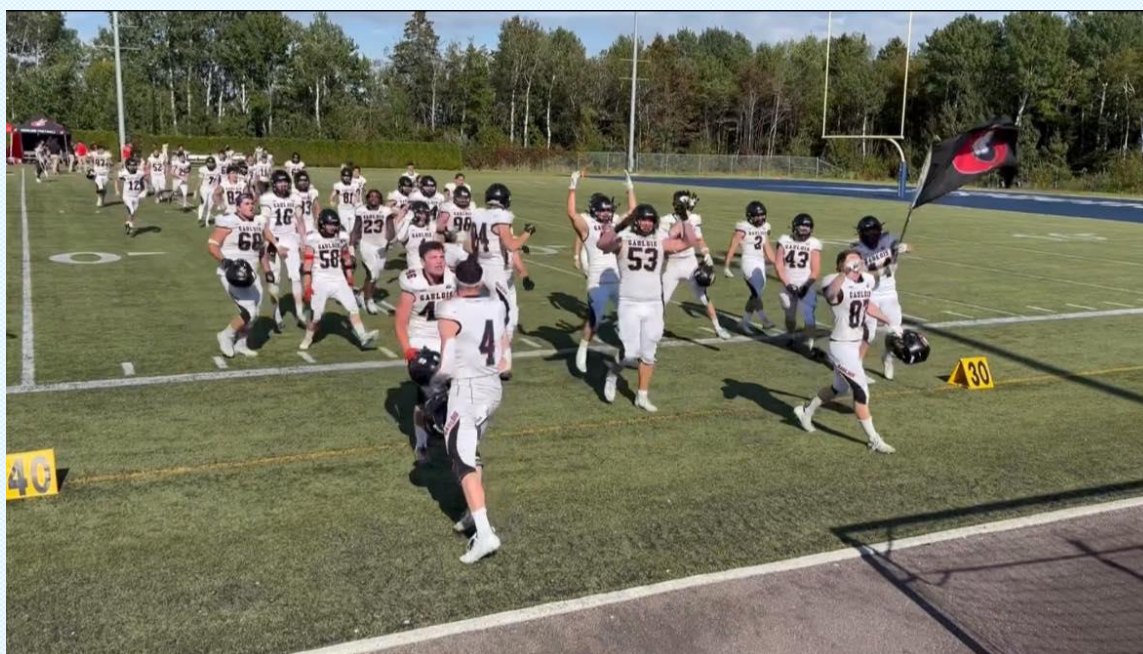
Les Gaulois victorieux 25-15 contre les Gaillards de Jonquière